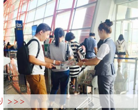
<<< 搭乗口での配布風景・空港職員による手配り >>>